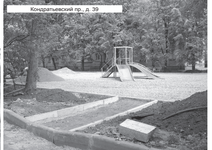
Кондратьевский пр., д. 39