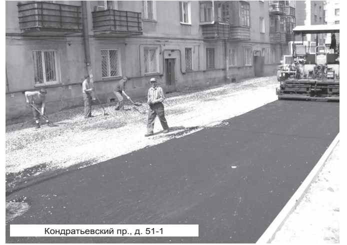
Кондратьевский пр., д. 51-1