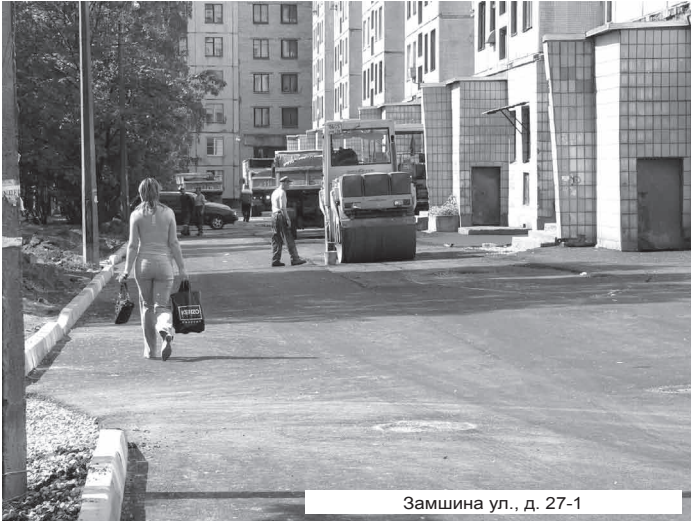
Замшина ул., д. 27-1

Благоустройство, как и в прежние годы остаётся, без сомнений, главной задачей Муниципального совета Финляндского округа.