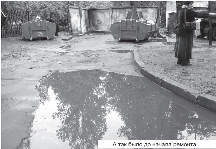
А так было до начала ремонта...