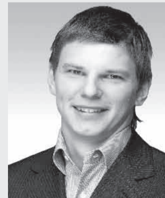
АРШАВИН Андрей Сергеевич

Ректор Санкт-Петербургского государственного университета