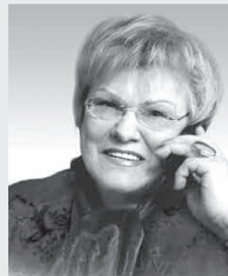
ВЕРБИЦКАЯ Людмила Алексеевна

председатель Законодательного собрания Санкт-Петербурга