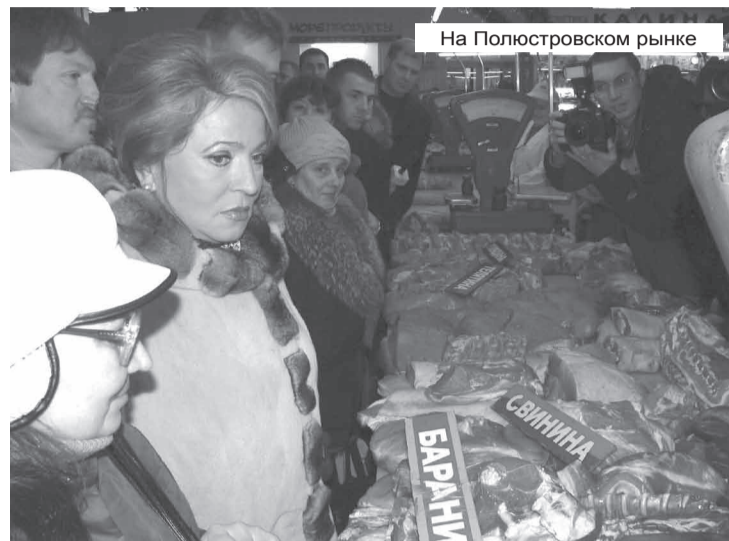
На Полюстровском рынке

Финляндский округ посетила губернатор Петербурга Валентина Ивановна Матвиенко. Она побывала на важнейших объектах, которые будут введены в строй предстоящей весной, побеседовала с жителями и проинспектировала Полюстровский рынок, состояние которого вызывает постоянные нарекания. Губернатора сопровождали глава администрации Калининского района М.М. Сафонов и глава Финляндского округа В.Ф. Беликов.