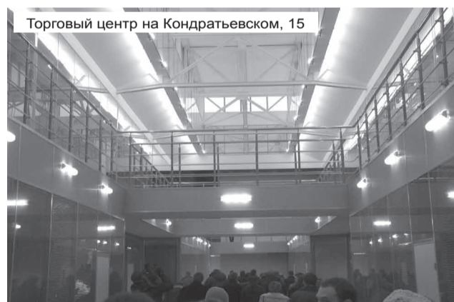
Торговый центр на Кондратьевском, 15

В 2006 году в жилых кварталах нашего района было отремонтировано почти 200 тыс. кв. метров асфальтового покрытия, более 80 тыс. кв. метров газонов, реконструировано 85 контейнерных площадок и оборудовано 10 детских площадок. Все это было сделано силами администрации города, администрации района и Муниципальных советов. Губернатор отметила весомый вклад, который внёс