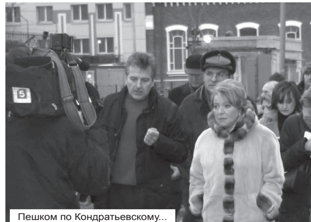
Пешком по Кондратьевскому...

В заключение рабочей поездки, длившейся около трёх часов, губернатор поблагодарила за проделанную работу админи-