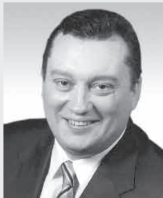
ТЮЛЬПАНОВ Вадим Альбертович

председатель Законодательного собрания Санкт-Петербурга