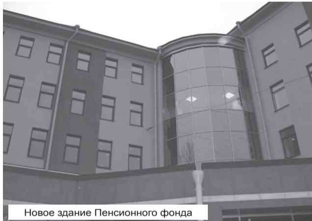
Новое здание Пенсионного фонда

Валентина Матвиенко внимательно выслушала жителей и сделала выговор руководителям рынка. «Вы меня подвели,