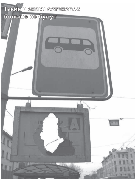
Такими знаками остановок больше не будут

Обидно, что новые знаки, как и прежние, страдают от вандализма. Ежедневно хулиганами калечится более 50 информационных щитов. Работники ГУП «Организатор перевозок» ежедневно проводят контрольные объезды по городу, демонтируют искаленные знаки, устанавливают новые. Об испорченных остановочных знаках можно сообщить по телефону 576-55-55.