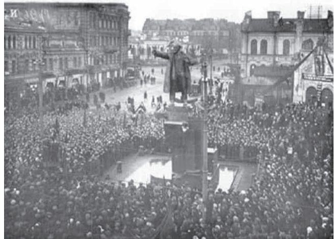
Открытие памятника. 1926 год.

История памятника началась восемьдесят лет назад – широко известно, что 3 апреля 1917 года на Финляндский вокзал приехал Владимир Ильич Ленин. Взорвавшись на броневик, он зачитал знаменитые апрельские тезисы, которые закончил не менее знаменитой фразой о курсе на социалистическую революцию.