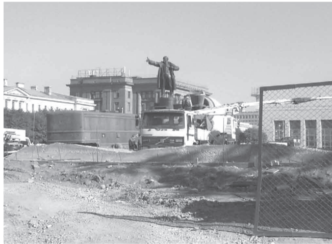
Последняя реконструкция. 2005 г.

Масштабное строительство 20-30-х годов требовало большого количества строительных материалов. Богатые надгробия многочисленных петербургских кладбищ прекрасно для этого подходили. Большевики убивали сразу двух зайцев: строительство ширилось, а память о гнилом буржуазном мире стиралась. На заре социалистического строительства ряд кладбищ в Петербурге был уничтожен полностью. До 1950 года просуществовало Выборгское римско-католическое кладбище, которое располагалось недалеко от Финляндского вокзала, в районе Арсенальной улицы. Это был крупнейший католический некрополь России, на котором лежало около 40 тысяч человек – поляков, немцев, французов, итальянцев. Здесь был по-