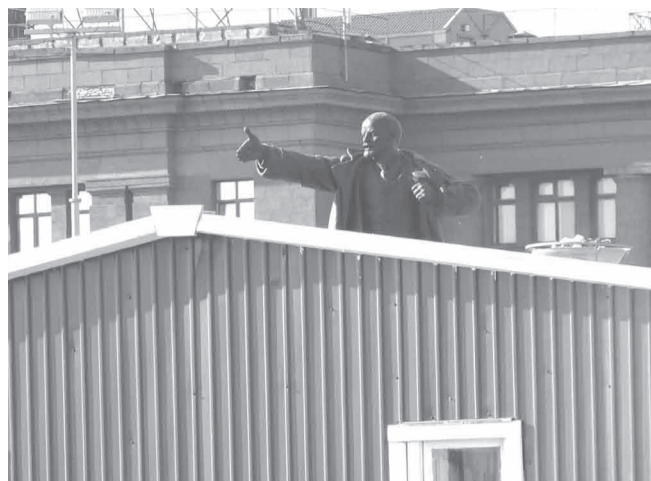
И сегодня живее всех живых... 2007 г.