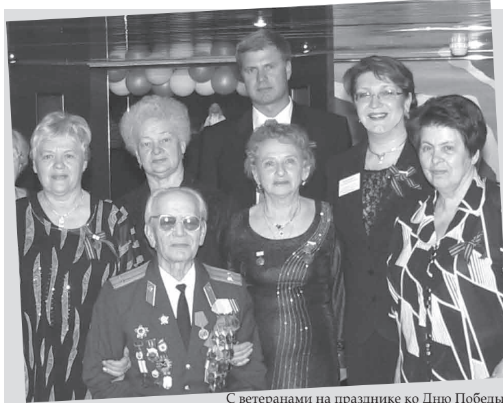
С ветеранами на празднике ко Дню Победы

Очередная встреча «Клуба читателей» газеты «Финляндский округ» состоится в понедельник, 14 апреля в 18.00 в библиотеке семейного чтения «Истоки» на ул. Васенко, д. 6. Приглашаем наших читателей поговорить о материалах газеты и темах для новых публикаций!