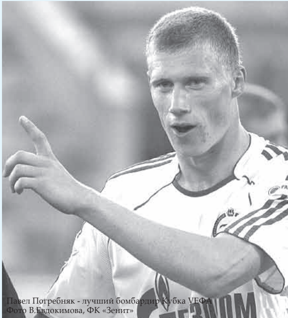
Павел Погребняк – лучший бомбардир Кубка УЕФА.

не обманешь» – заявлял тренер «Спартак». И мы к таким объяснениям уже попривыкли, даже уверовали в них. Мол, ничего тут и не поделаешь... Но вот беда, раз за разом этот алгоритм начинает давать сбои. Сначала ЦСКА выигрывает Кубок УЕФА, затем «Зенит» (уже, кстати, второй раз за последнее время) выходит в четвертьфинал этого турнира, переигрывая по пути очень грозных соперников. Так что получается – Адвокат обманул физиологию? Или же лукавят те, кто пытается навязать нам этот самый псевдовесенний футбол? Ответ прост: всегда легче оправдать неудачи чем угодно, нежели признать свои собственные ошибки. А Адвокат никого не обманывал, просто очень профессионально подготовил команду к сезону. Отсюда и результат.