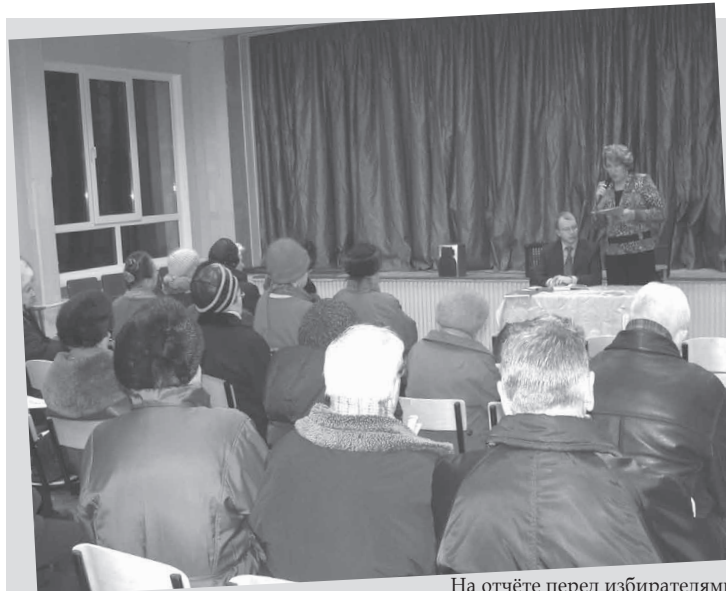
На отчёте перед избирателями