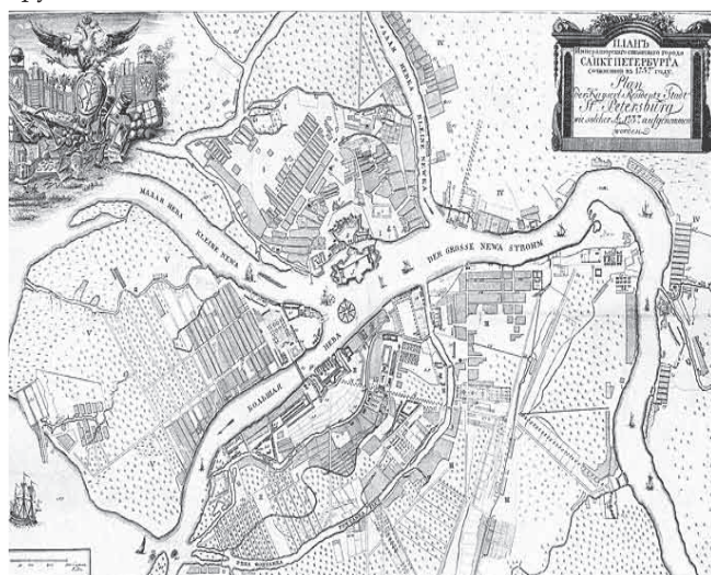
План Санкт-Петербурга. Гравюра 1743 года.

Спустя ещё два года для Теплова был готов «дом Готического вкуса». Он несколько отличался от нынешнего дворца на набережной. Здание уже имело три этажа, на втором присутствовали два балкона, а по сторонам стояли две круглые башни.