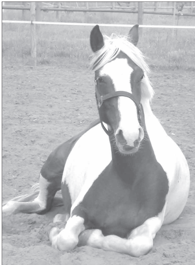
Когда «аттракцион» перестает приносить прибыль, конягу сдают на мясокombинат...

«Мы поставили парк на контроль сразу, как получили ваше сообщение. Однако ни одного «покатушника» в