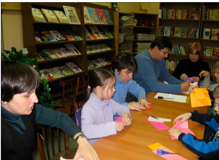
В библиотечной «мастерской» интересно будет всем

На этой странице Странные птицы Странно летают! А тут: Странные люди Стоят очень странно, И странные пальмы растут.