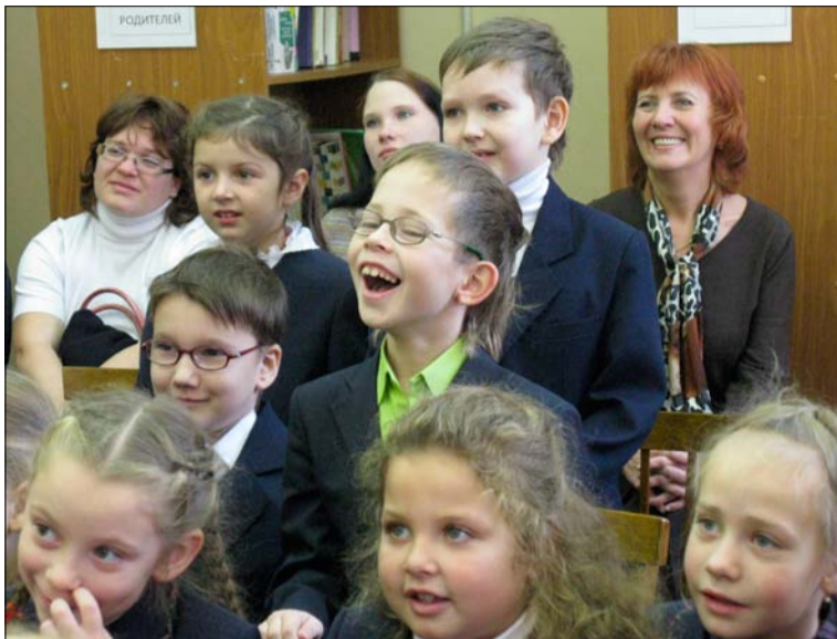
Кто сказал, что в библиотеке должно быть тихо и скучно?

Так же в наших силах провести для индивидуальных посетителей, групп и классов уроки библиотечной грамотности: подробно расскажем о книжном фонде абонемента, правилах пользования библиоте-