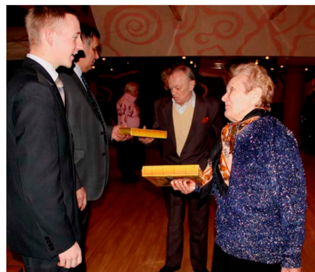
После концерта – сладкие подарки