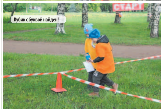
Кубик с буквой найден!