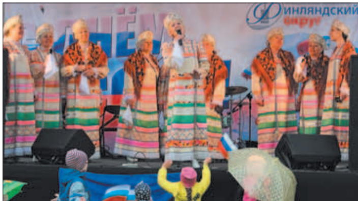
Коллектив русской песни «Крупничка».

флага в качестве символического подарка к празднику от организатора мероприятия, Муниципального совета и Местной администрации Финляндского округа, получили все дети, пришедшие на уличные гуляния.