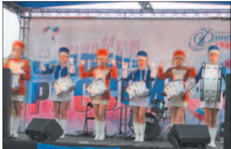
Шоу-группа барабанщиц «Малая Охта»