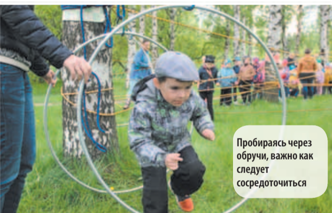
Пробираясь через обручи, важно как следует сосредоточиться