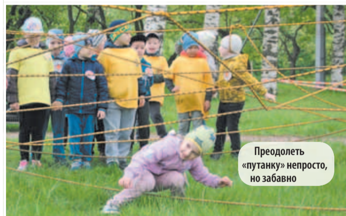
Преодолеть «путанку» непросто, но забавно