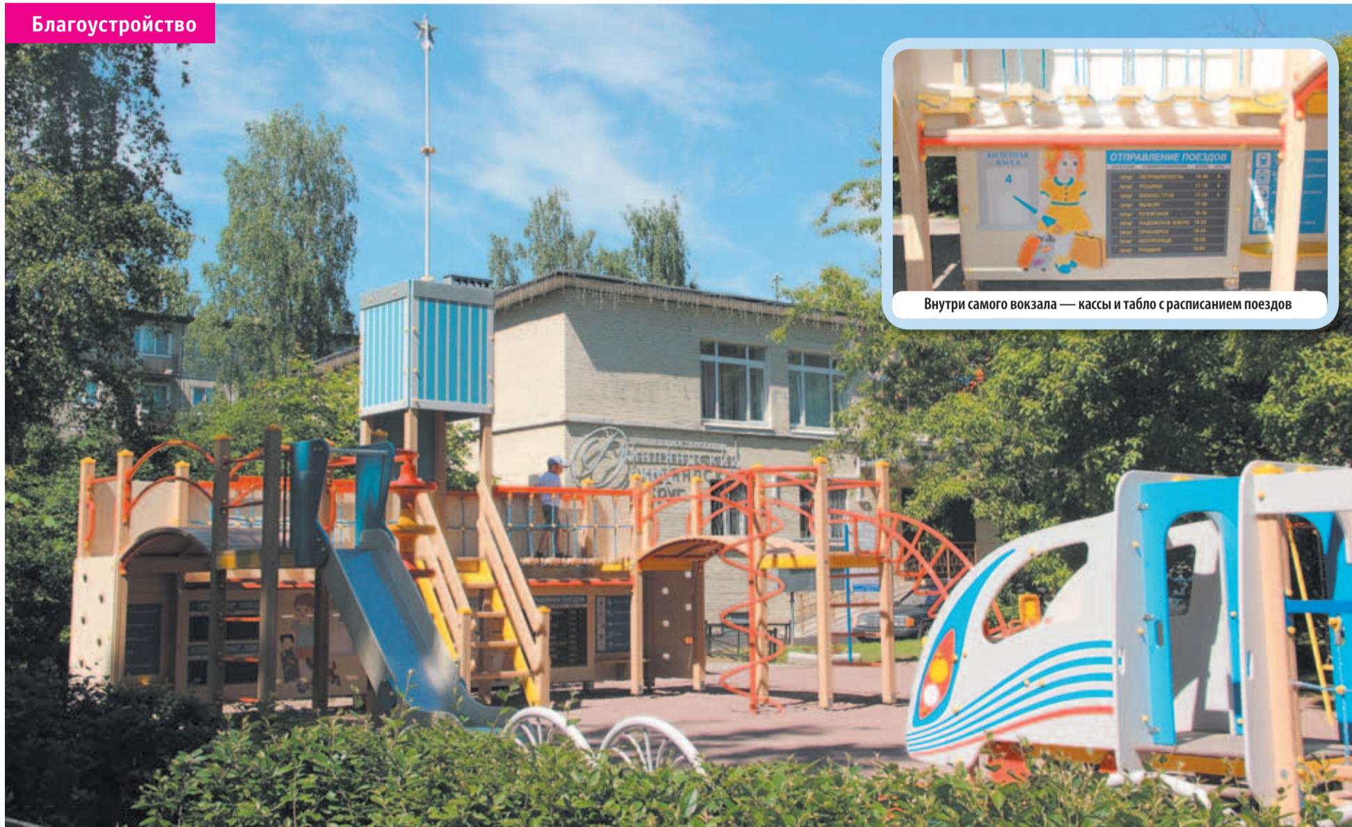
Внутри самого вокзала — кассы и табло с расписанием поездов