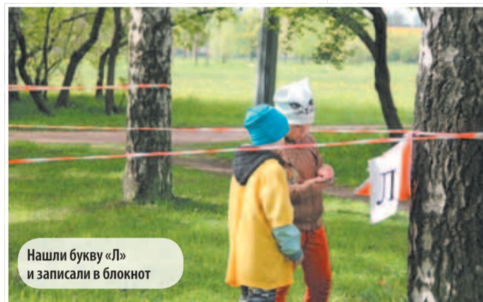
Нашли букву «Л» и записали в блокнот