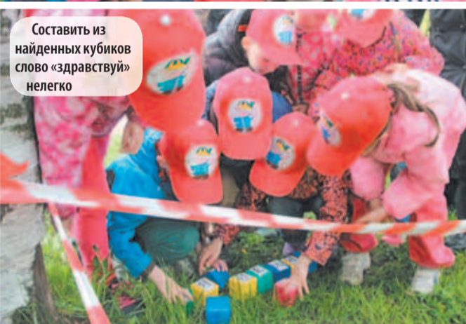
Составить из найденных кубиков слово «здравствуй» нелегко