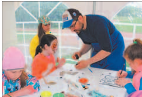
Площадка «Роспись на футболках» – занимательное дополнение к празднику.

Для желающих сделать фото на память работала фотобудка. Печать моментального фото тоже была бесплатной. Маленькие флажки-триколоры и шаррики цветов российского