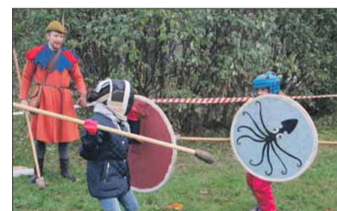
Поединок на копьях

Разноцветные воздушные шары белого, красного и голубого цветов, которые раздавали и взрослым, и детям в ходе мероприя-