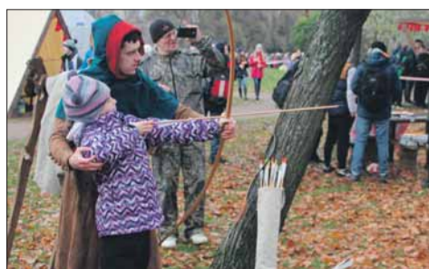
Почувствовать себя Робинем Гудом смогли не только мальчишки

Любашинский парк вновь стал местом встречи жителей Финляндского округа. Накануне Дня народного единства Муниципальный совет устроил здесь традиционные уличные гуляния.