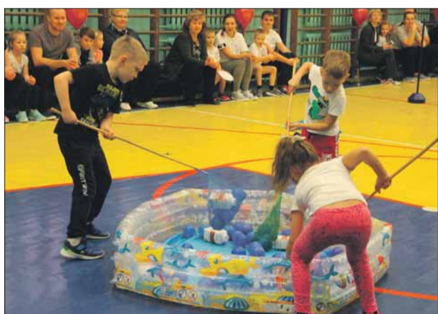
Эстафета «Чистая вода». Очистка «водоема» от мусора

Пробежать с сачком в руках, перепрыгивая через препятствия-«ручейки», подлезая под «воротики», чтобы очистить «водоем» от мусора – выполнить все этапы эстафеты