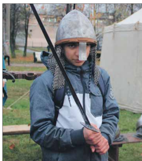
В образе средневекового воина

Особый интерес на празднике у жителей в Любашинском парке вызвали интерактивные зоны. «Мост Тролля», «Балда для рубки», лагеря Российской армии, викингов и вятизей, точка «Спортивное копьё» стали живыми уроками истории нашей страны. Как жили нашим предкам и чего стоило воинам Древней Руси сражаться с врагом за свободу и независимость нашей Родины, испытал на себе каждый, кто прикоснулся к оружию, представленному реконструкторами в парке. Юным мальчишкам и ребятам постарше была предоставлена возможность сразить-