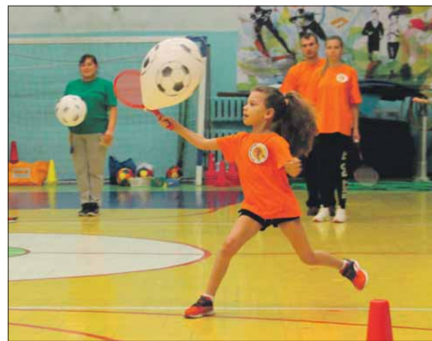
Эстафета «Послушный шар». Дети должны пронести на ракетке воздушный шарик от старта до финиша

ОБЪЯВЛЕНИЕ 28 декабря 2017 года в 15:00 по адресу: ул. Федосеенко, д. 30 состоится собрание учредителей местной общественной организации Талышская национально-культурная автономия муниципального округа Финляндский для принятия решения о государственной регистрации.