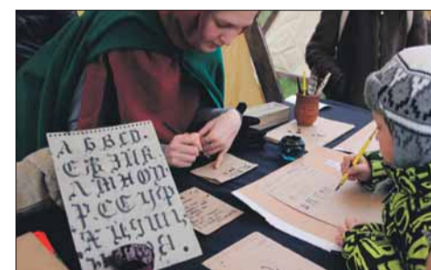
Урок каллиграфии. Готический шрифт выводили пером

тия, не только стали дополнительным украшением на гуляниях, но и привнесли особое, праздничное настроение. Любители значков смогли пополнить свои коллекции новым, редким поступлением – значком, который нигде не купишь: специально для праздника Местная администрация Финляндского округа организовала его выпуск. Значки с изображением русского богатыря как символа силы и мудрости народа и с надписью «День народного единства» муниципальные служащие жителям дарили на память. На память в фотобудке здесь же можно было сделать бесплатное моментальное фото и унести частичку праздника с собой. Угощали гостей солдатской кашей и горячим чаем.