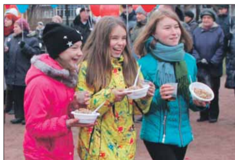
Блюдо дня – гречневая каша на свежем воздухе с праздничным настроением