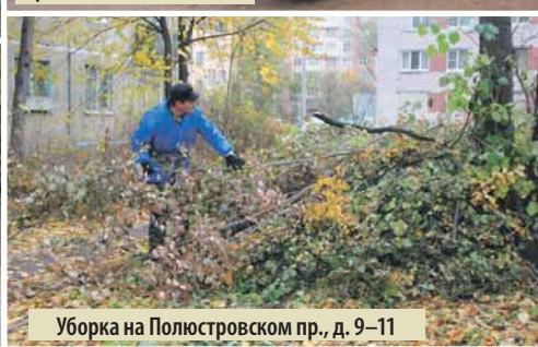
Уборка на Полюстровском пр., д. 9–11