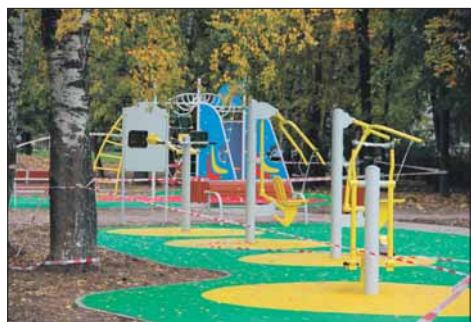
Кондратьевский пр., д. 79; 81, корп. 1