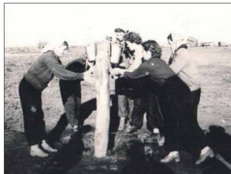
И мы на целине мыслили!