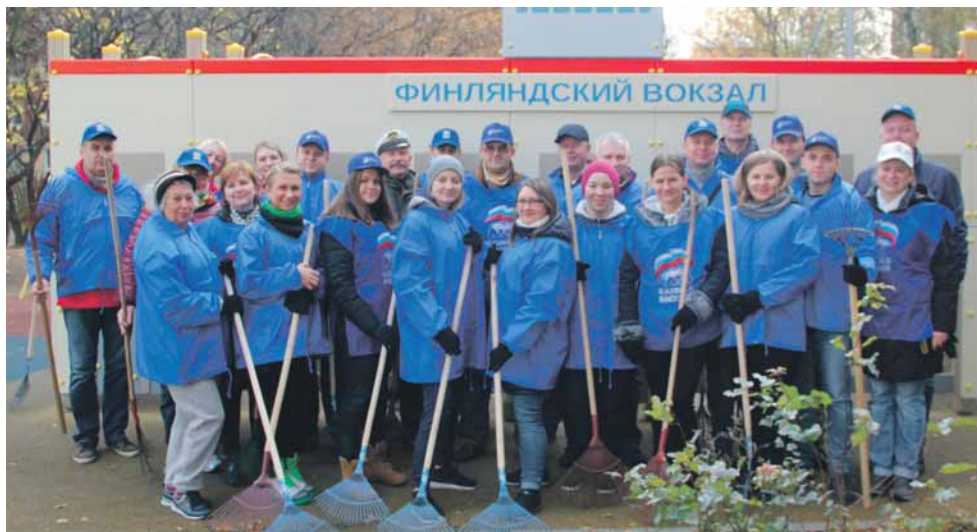
Депутаты Муниципального совета и муниципальные служащие перед началом субботника