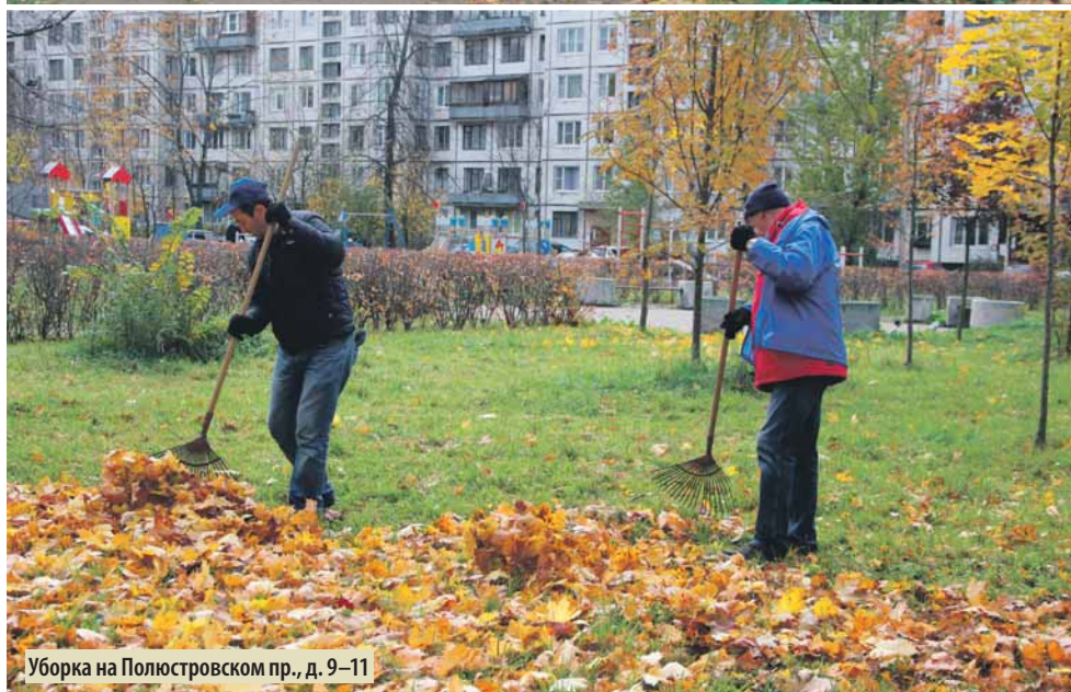
Уборка на Полюстровском пр., д. 9–11