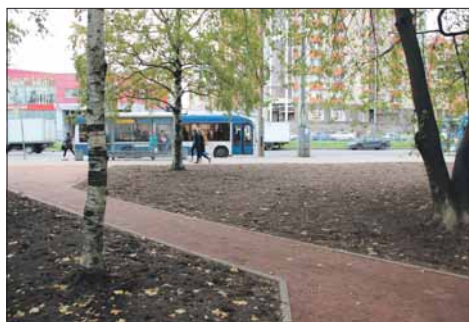
Кондратьевский пр., д. 75, корп. 1