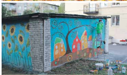
Гараж на пр. Металлистов, д. 93 повеселел