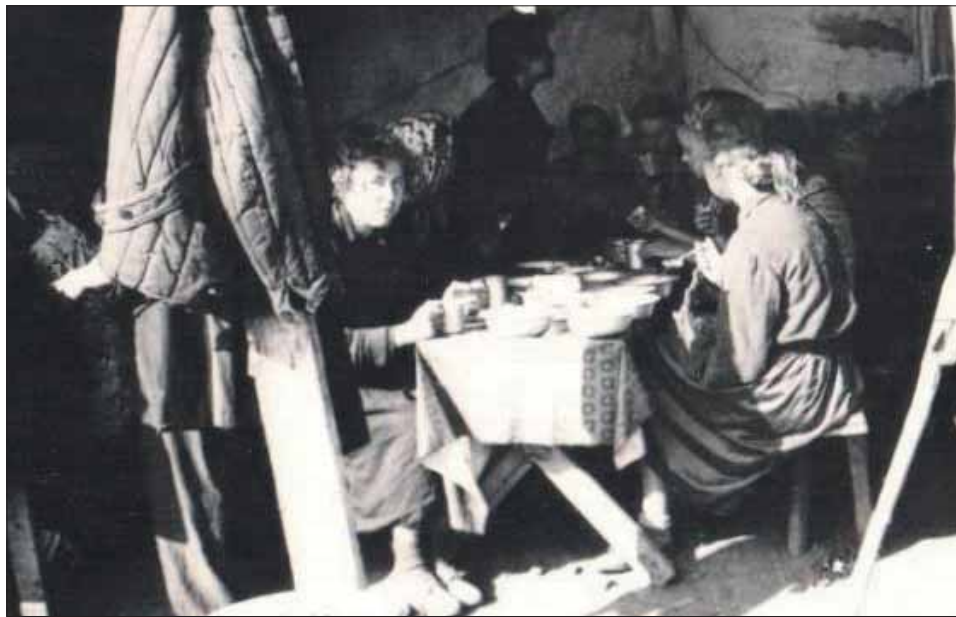
Наша столовая

перемешивали её с соломой и сухим навозом, выкладывали все это в формочки и выстраивали кубики. Под палящим солнцем они быстро высыхали. И так, кубик за кубиком, снизу до верха возводилась стена дома. Крыша – из соломы. Вот в таком самане мы и жили, спали на раскладушках, и было довольно уютно. Кухня находилась отдельно, под большой военной палаткой. Все, кажется, было готово к жизни, быту. И началась «битва за урожай».