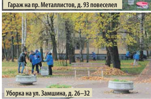
Уборка на ул. Замшина, д. 26–32