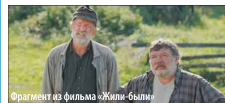
Фрагмент из фильма «Жили-были»

В кинотеатре «Фильмофонд» жителям округа показали новую кинокомедию «Жили-были», рассказывающую о сельских жителях, жизни в глубинке и простом человеческом счастье. Кинокартина позволяет окунуться в то время, которое уже не вернуть, насладиться красотой деревенской природы.