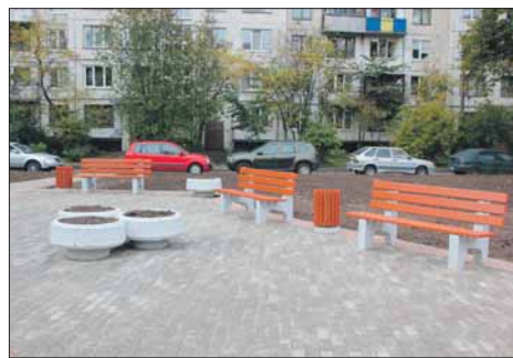
Кондратьевский пр., д. 79; 81, корп. 1

Заиграл новыми красками еще один двор на Кондратьевском проспекте. Между домами 79 и 81, корп. 1 появилась просторная зона отдыха и детская площадка с резиново-каучуковым покрытием, скамейками и урнами. На площадке установлен спортивный комплекс «Каскад» для детей от 6 до 12 лет и тренажеры, рассчитанные на возраст 14+. Техника выполнения упражнений и правила эксплуатации площадки описаны на информационном стенде. Кроме того, на стенде можно прочитать лаконичное обращение главы Финляндского округа Всеволода Беликова к жителям: «Мы искренне старались создать