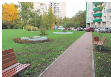
ул. Замшина, д. 31, корп. 4