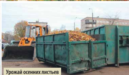
Урожай осенних листьев