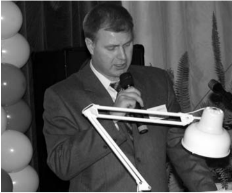
Уважаемые жители округа!

Муниципальный совет и местная администрация Финляндского округа продолжают традицию отчетов о своей работе перед жителями муниципального образования.