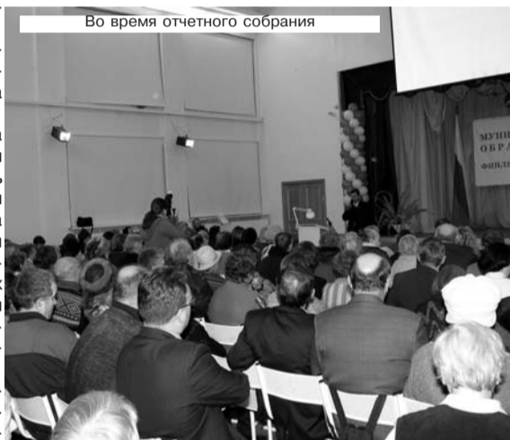
Во время отчетного собрания

21 ноября вступил в силу новый Устав муниципального образования Финляндский округ. Основным документом округа приведён в соответствие с обновлённым федеральным и городским законодательством. Полный текст Устава опубликован в специальном номере нашей газеты, получить который вы можете в Муниципальном совете (Кондратьевский пр., д. 34).