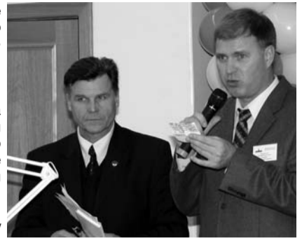
нов и причём не все охватываются?

Объясните, какая перспектива с бадами? И почему так мало дают тало-