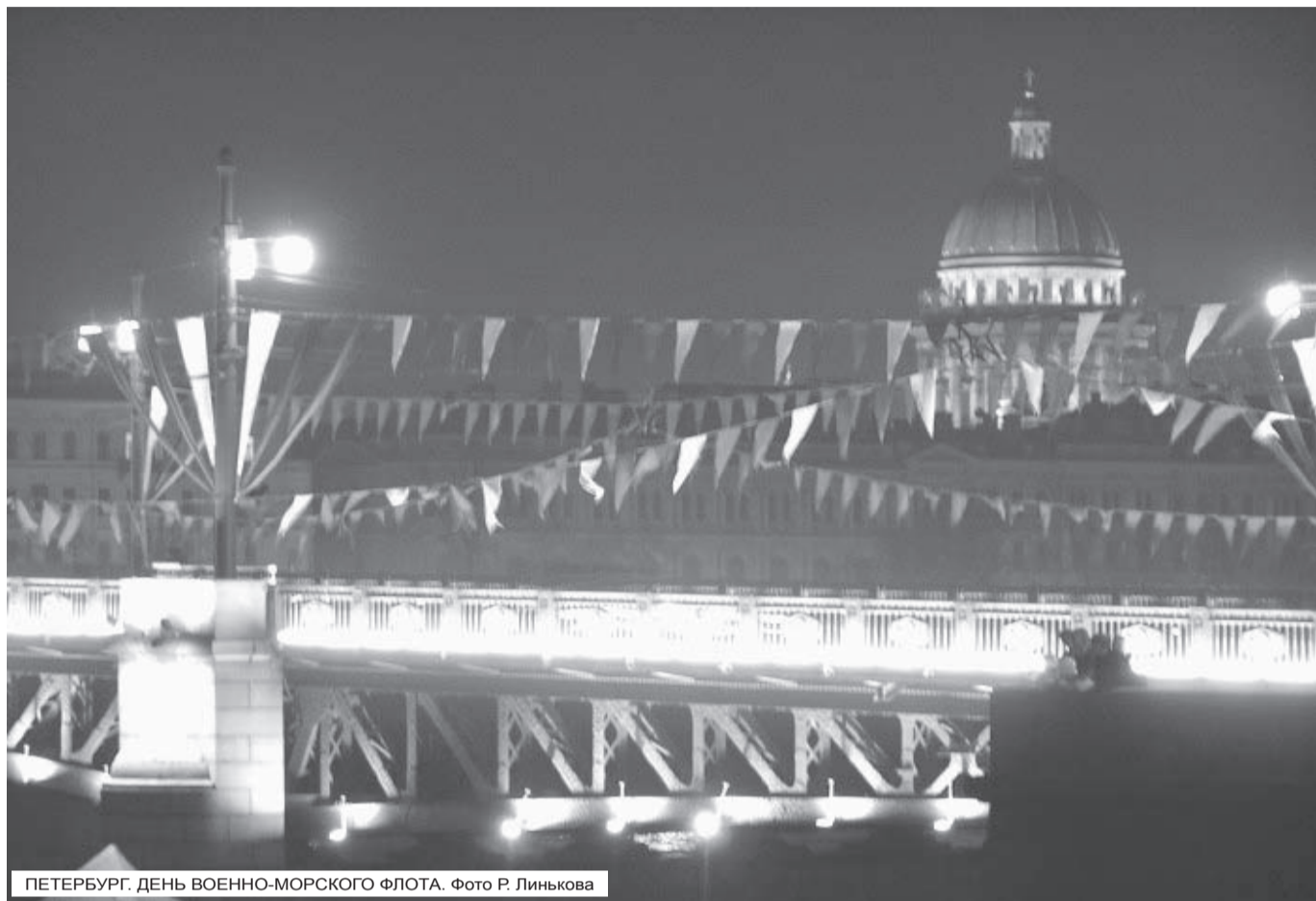
ПЕТЕРБУРГ. ДЕНЬ ВОЕННО-МОРСКОГО ФЛОТА.

По материалам пресс-служб губернатора и Законодательного собрания Санкт-Петербурга