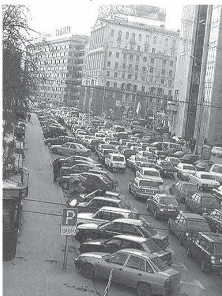
Замшина улица превратится в Чикаго?

Почему же все эти ООО идут иным путем? Почему пытаются разместить автопаркинги вблизи жилых домов? Ответ очень простой - деньги. Стоимость аренды там несколько ниже, необязательно и тратиться на рекламу новой стоянки - ее и так заметят. В результате, такое строительство окупается за считанные месяцы.