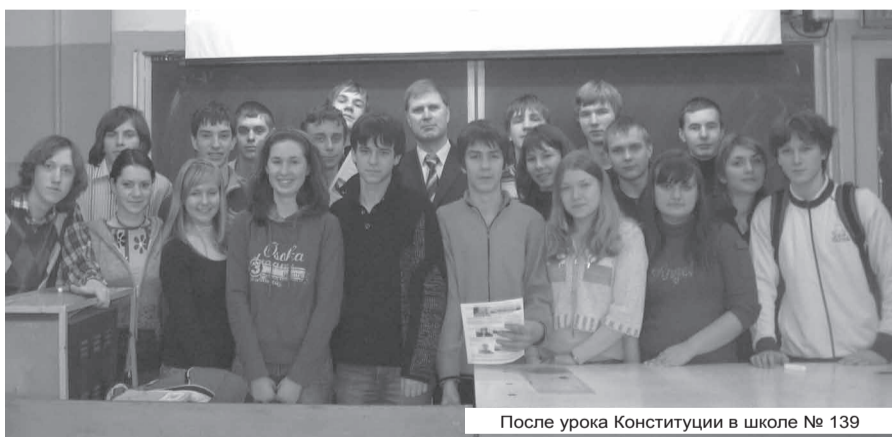
После урока Конституции в школе № 139

спекте Металлистов, за клубом «Ferum». Теперь ребята вместе со своими друзьями отдыхают не с бутылкой пива в руках, а за-