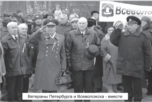
Ветераны Петербурга и Всеволожска - вместе

В дни празднования 65-летия со дня открытия легендарной Дороги жизни, ветераны и блокадники Финляндского округа посетили торжественную встречу в ветеранами Всеволожского района Ленинградской области, которая состоялась на берегу Ладожского озера, у памятника «Разорванное кольцо».