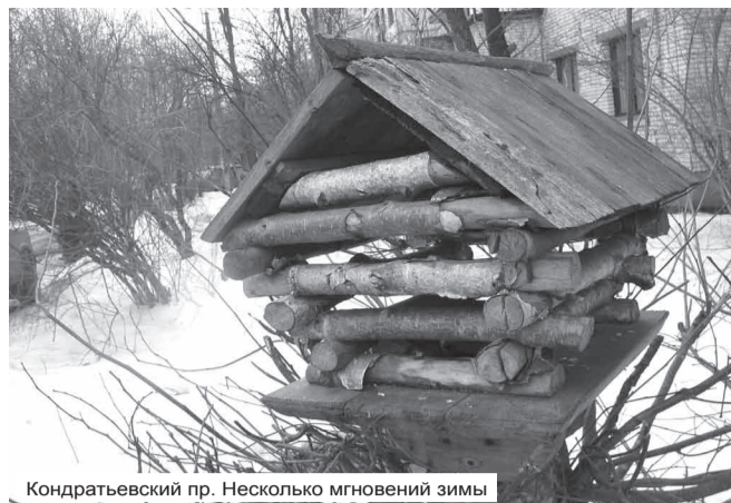
Кондратьевский пр. Несколько мгновений зимы

Телефон для справок: 09, 059, 069 и на сайт www.ptn.ru