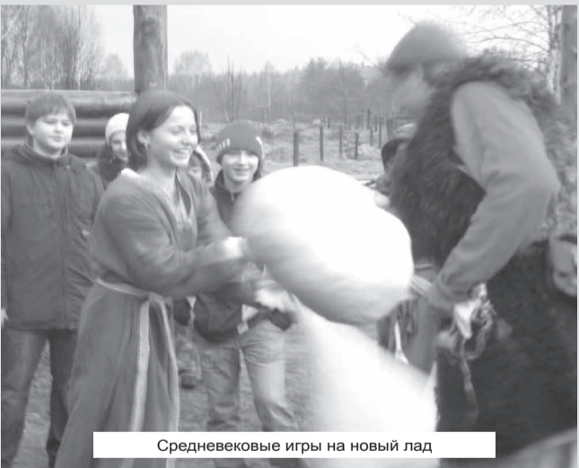
Средневековые игры на новый лад

Или слышали что-нибудь о нем? Под Выборгом только заканчивается строительство этнодеревни викингов «Свенгард», но она уже принимает первых туристов. Местом строительства не случайно выбрали берег озера Петровское. Как утверждают историки, в XI — XII веках здесь пролегла часть пути «Из варяг в греки». Эти края тогда считались богатыми рыбой и пушниной.