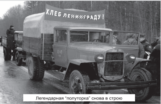
Легендарная "полупанорама" снова в строю