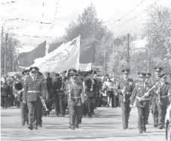
Торжественное шествие по пр. Мечникова

Вот уже 62 года май - особый месяц для нашей страны. Вместе с пробуждением природы, вместе с первыми лучиками тёплого весеннего солнца, мы встречаем самый главный и самый близкий для каждого ленинградца праздник - День Победы. В первой половине мая в нашем районе состоялось немало праздничных событий. Мы предлагаем вам фоторепортаж о них, подготовленный нашими корреспондентами.