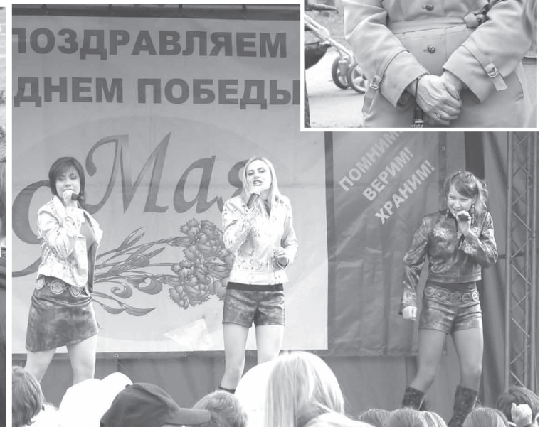
Уличные гуляния в Любашинском парке на Замшиной ул.