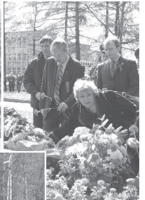
Возложение цветов к обелиску памяти на Богословском кладбище