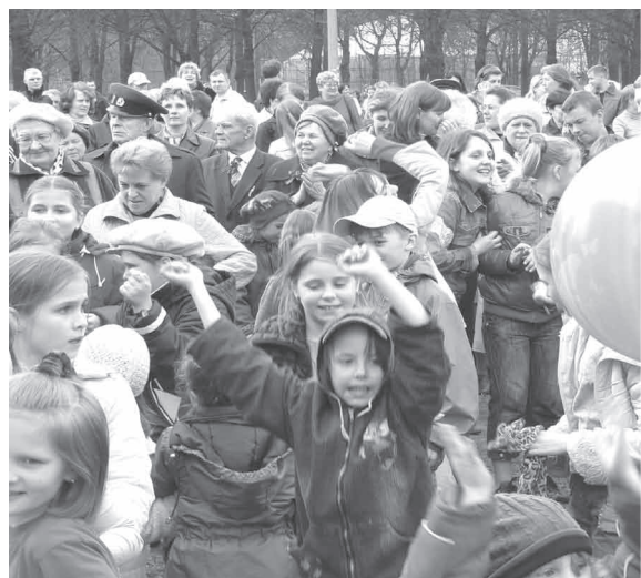
Праздник в Любашинском парке продолжался почти четыре часа