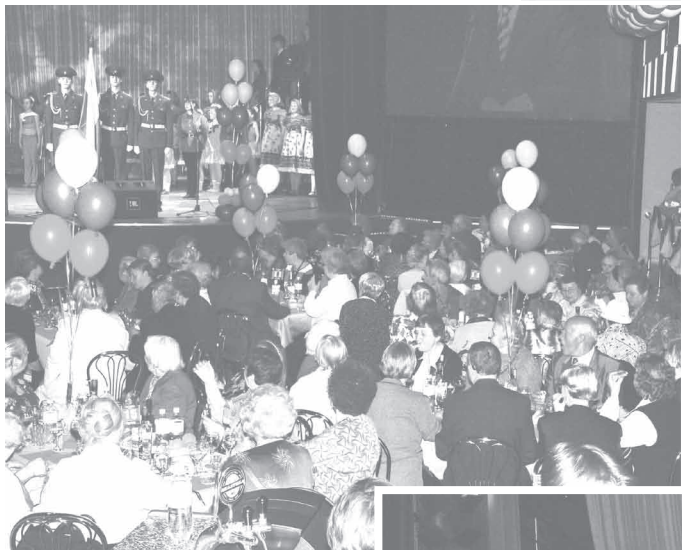
Традиционный торжественный вечер для ветеранов и блокадников Финляндского округа состоялся в большом зале «Гигант-холла»