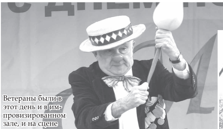
Ветераны были в этот день и в импровизированном зале, и на сцене