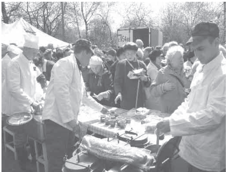
Содатская каша и «фронтовые» из полевой кухни на празднике в Пионерском парке (Пискаревский пр.)