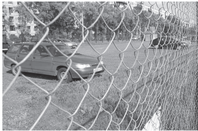
На парковочном фронте без перемен...

Мы уже не раз писали о незаконной стоянке возле дома 50 по Замшиной улице. Ситуация сдвинулась с мертвой точки. В ста метрах от старой парковки появилась новая. Как говорят, законная.