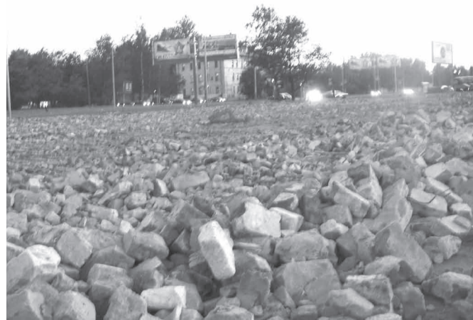
А вот так выглядит новая парковка