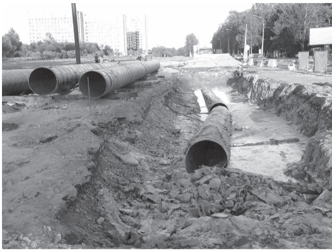
На пересечении с Бестужевской улицей...