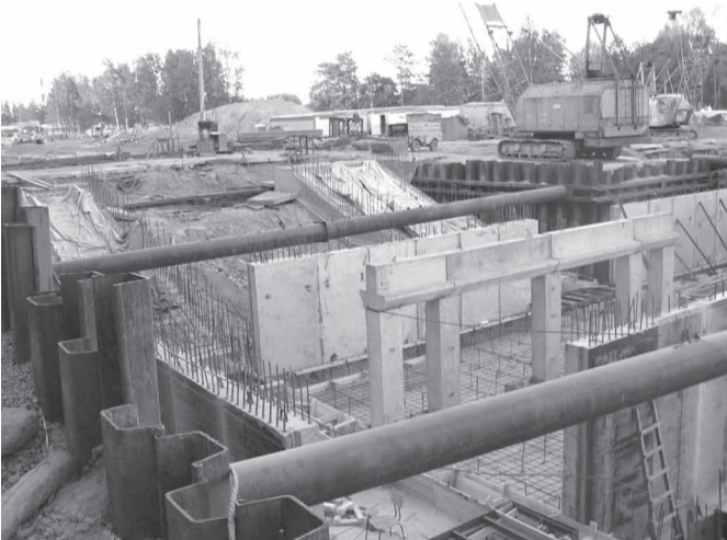
А так сегодня выглядит будущий подземный переход

Объем выполненных работ за год - немалый. Проезжую часть расширили до 25 метров, теперь движение будет осуществляться по трем полосам в каждом направлении. В ходе работ были отремонтированы или заменены инженерные сети - водопровод, дождевая канализация, телефонные и электрические кабели, теплосеть, магистрали