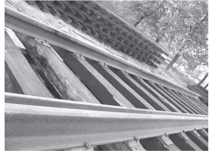
По этим рельсам больше не ходят трамваи

Нерешённой осталась и другая проблема - в том же комитете нам сообщили, что подземный переход на Пискаревском проспекте будет только один - возле станции «Пискаревка». Как в таком случае при скоростном движении