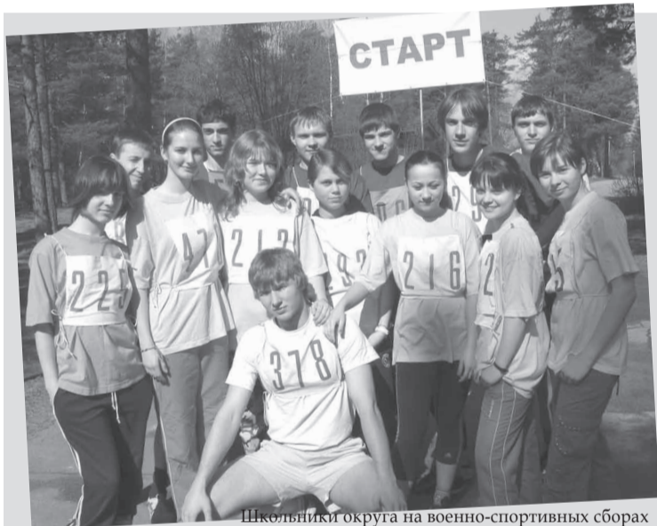
Школьники округа на военно-спортивных сборах