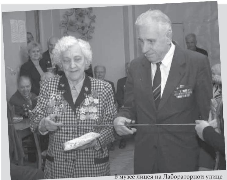
В музее лицея на Лабораторной улице

ле» для поздравления лучших работников бюджетной сферы - школ, детских садов, библиотек, поликлиник, социальных служб. В дни профессиональных праздников мы с удовольствием приглашаем работников бюджетных учреждений нашего округа на экскурсии по Петербургу, а также в Новгород, Тихвин, Петродворец, Стрельну и другие исторические места. Продолжение на стр. 6 >>>