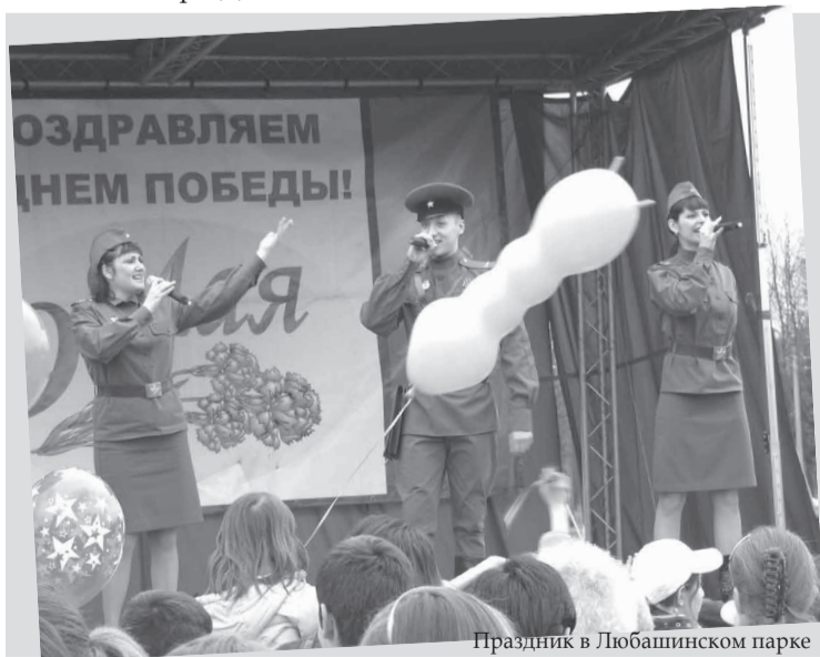
Праздник в Любашинском парке