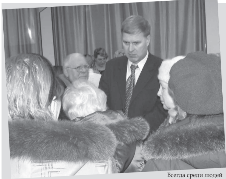
Всегда среди людей

всегда востребована жителями округа. На страницах «Финляндского округа» поднимаются острые проблемы, публикуются материалы о жизни округа, выходит много полезной информации для граждан. Газета стала по-настоящему эффективным средством обратной связи между властью и жителями округа, защитницей интересов граждан. Не менее успешным проектом считаем и «Справочник жителя Финляндского округа», который в 2008 году выйдет уже в третий раз.