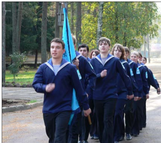
Команда школы № 186. Сентябрь 2006 года