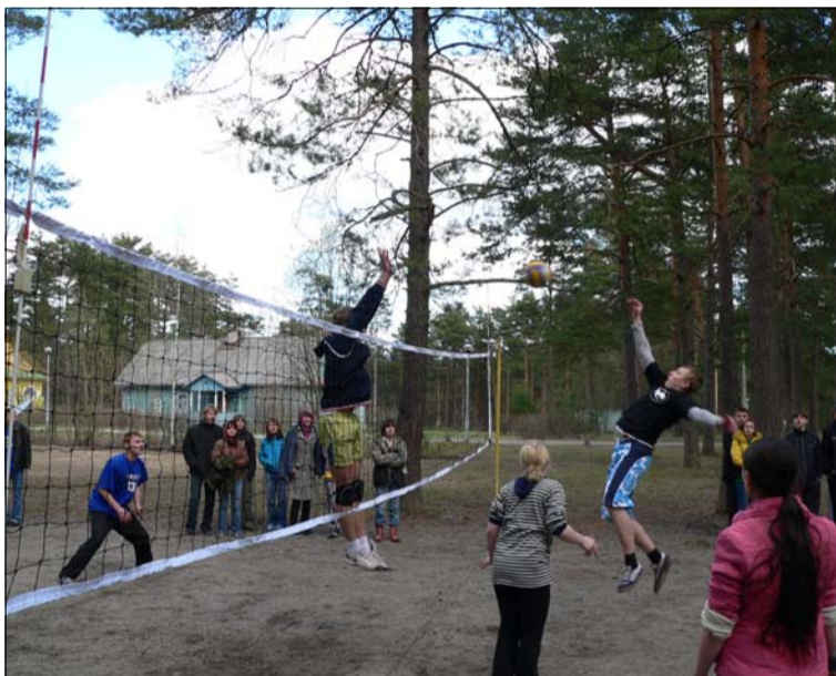
Волейбольная баталия. 2008 год