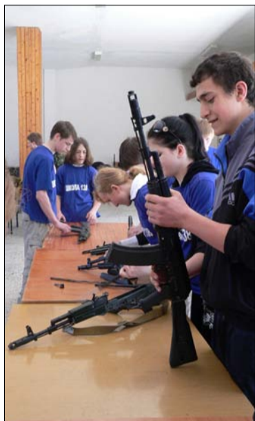
Разборка-сборка автомата. 2007 год