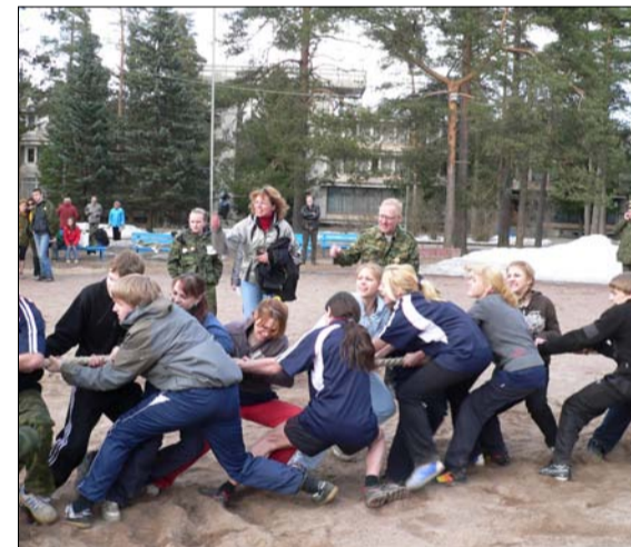
Перетягивание каната. 2009 год