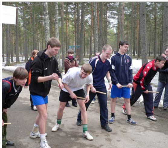
На старте эстафеты. Апрель 2009 года