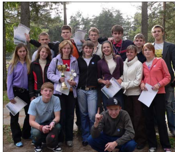
Команда лицея № 126. 2006 год