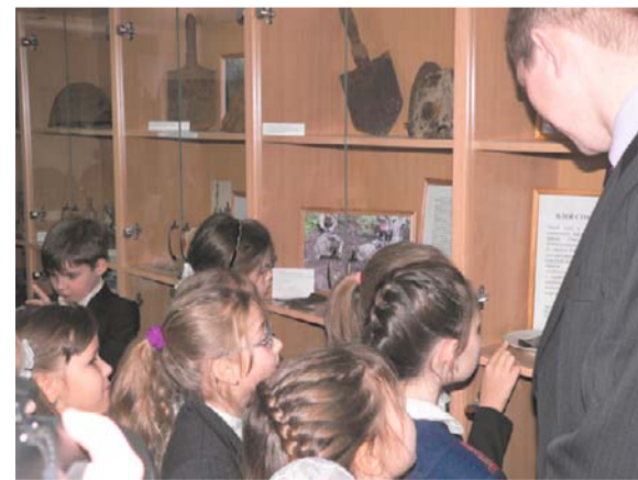
На экспозиции в Муниципальном совете Финляндский округ

Выставка, посвященная Великой Отечественной войне, работает и в Муниципальном совете Финляндский округ. На ней представлены экспонаты, найденные на местах боев 1941–43 гг. под Ленинградом. Посетить выставку может каждый желающий в любой день, кроме субботы и воскресенья, по адресу: пр. Металлистов, д. 93 А.