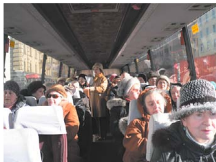
Во время обзорной экскурсии по городу

Проводить экскурсии для жителей Финляндского округа стало уже хорошей традицией. Очередную поездку Муниципальный совет организовал 26 и 27 марта. Экскурсанты совершили обзорную экскурсию по Петербургу, осмотрели главные достопримечательности города, посетили Дворец Половцева, известный как Дом архитектора. Побывали в его великолепных залах и узнали много нового о Государственном Секретаре Двора Александра III – сенаторе Половцеве, по имени которого обычно и называют дворец.