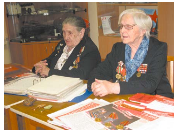
В комнате боевой славы «Поиск и память» часто проходят встречи школьников с ветеранами Великой Отечественной войны

Наш адрес: ул. Васенко, д. 6, тел. 540-60-41, 541-32-21