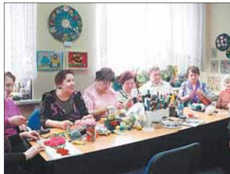
Посетители отделения активно занимаются творчеством

Помимо всего этого посещение отделения дает возможность познакомиться с но-