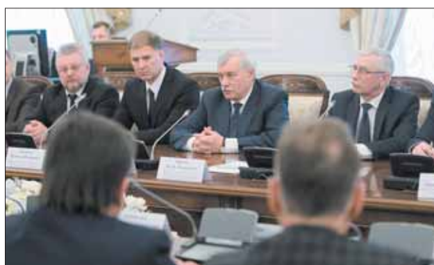
Во время подписания Соглашения в Смоленском

– Я – точно противник того, чтобы все возвращались в царское время, когда служили 25 лет. А если серьезно, мне