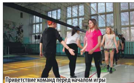
Приветствие команд перед началом игры