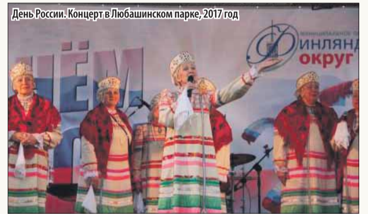
День России. Концерт в Любашинском парке, 2017 год