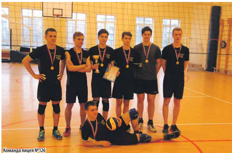
Команда лицей №126

С 10 по 17 апреля прошли соревнования по волейболу среди учащихся школ округа. Соревновались команды девушек и команды юношей. Общекомандное место среди школ определялось по лучшей сумме занятых мест юношами и девушками, в случае равенства очков место определялось по лучшему результату, показанному командой девушек.