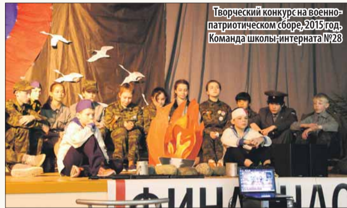
Творческий конкурс на военно-патриотическом сборе, 2015 год. Команда школы-интерната №28

ниченный улицей Замшина, проспектом Маршала Блюхера, Пискаревским проспектом и Бестужевской улицей.