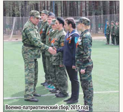
Военно-патриотический сбор, 2015 год

Депутаты сумели предотвратить строительство многоэтажки в сквере возле школы № 146. Вместе с жителями спасли от уплотнительной застройки квартал, огра-