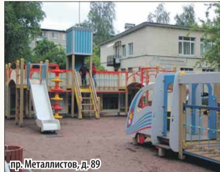
пр. Металлистов, д. 89