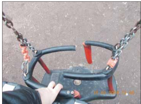
пр. Металлистов, д. 104

Это в песне поется «В юном месяце апреле в старом парке тает снег. И веселые качели начинают свой разбег...». В жизни далеко не всегда качели выглядят веселыми, катаясь на которых можно обо всем забыть и лететь навстречу небу, не ведая преград. Часто преградой становится хулиганство и варварство.