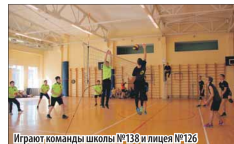
Играют команды школы №138 и лицей №126