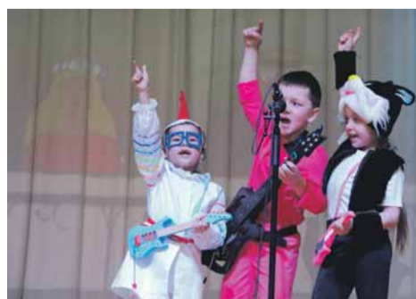
История про бременских музыкантов. Детский сад № 9