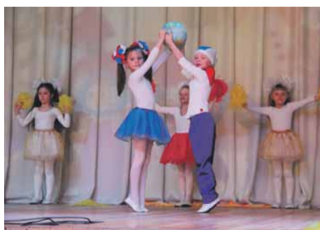
Номер «Мы – дети солнца». Детский сад № 32