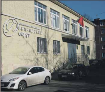
Здание Муниципального совета Финляндского округа