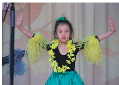
Чунга-чанга. Детский сад № 12

Управление МВД России по Калининскому району Санкт-Петербурга приглашает на службу ..... 8