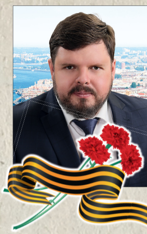
Депутат Государственной Думы РФ Евгений МАРЧЕНКО

От всего сердца поздравляю всех жителей Калининского района с праздником! Желаю каждому счастья, здоровья, долгих лет жизни и мирного неба над головой!