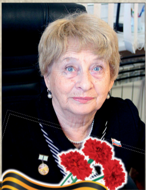
Председатель Калининско-го районного отделения общественной организации «Жители блокадного Ленинграда»