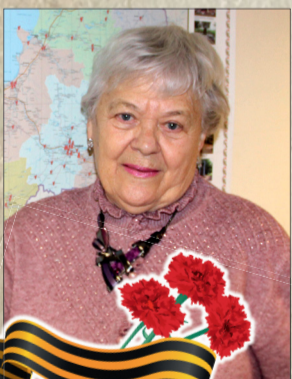
Председатель Общественной организации МО Финляндский округ «Жители блокадного Ленинграда»

Дорогие мои, пусть мир и благополучие всегда будут в ваших домах! Примите самые искренние, самые теплые поздравления! Я желаю всем счастья, здоровья, удачи, сердечного тепла, бодрости духа и долгих лет жизни!